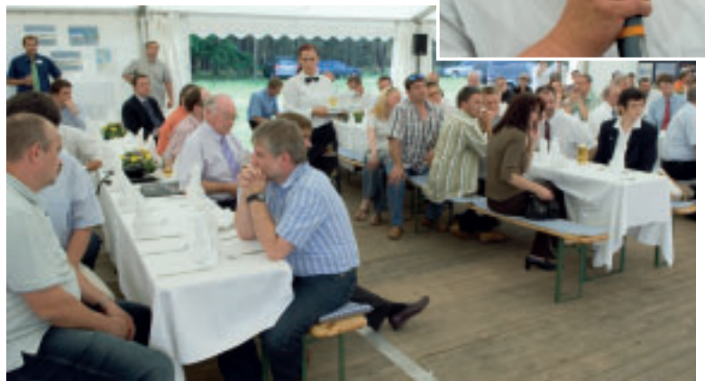
Nahezu 100 Gäste waren unserer Einladung zum Richtfest gefolgt.